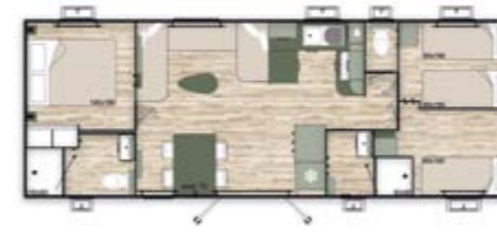
Dimensions : 10,5x4m 3 chambres - 2 salles de bains