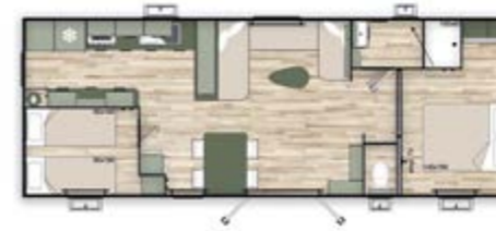
Dimensions : 10,5x4m 2 chambres - 1 salle de bain