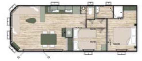
Dimensions : 10,5x4m 2 chambres - 1 salle de bain