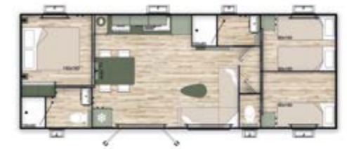
Dimensions : 10,5x4m 3 chambres - 2 salles de bains

Dimensions : surface d'encombrement au sol